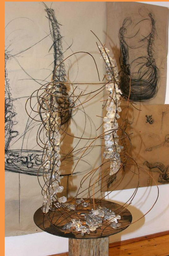
Vojtěch Starosta (A3)

Z investičních záměrů se nejvíce těšíme na završení rekonstrukce střechy a otevření nových podkrovních ateliérů v areálu v Revoluční ulici, k němuž by mělo dojít v říjnu letošního roku. Nové ateliéry budou také nově vybaveny kreslicími deskami, malířskými stojany a výtvarnými potřebami, což ještě zvýší kvalitu vyučování výtvarných oborů ve všech typech studia, nový obor Design interiéru nevyjímaje.