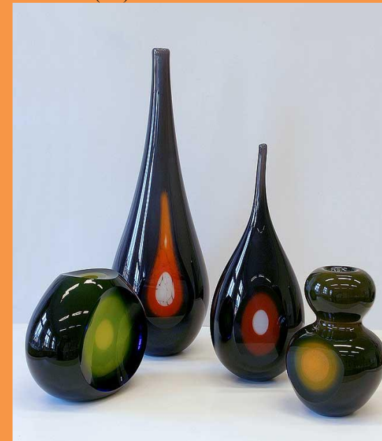
Lenka Pernická (A3)